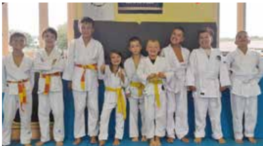
Poussins & Benjamins